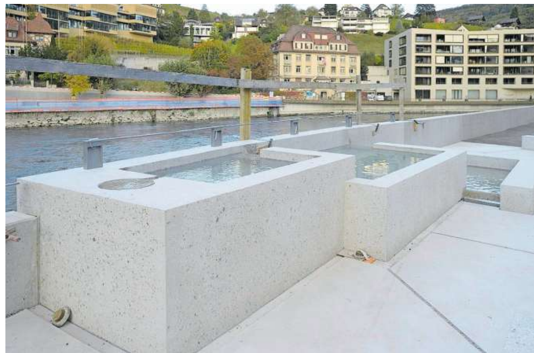
Thermalbad-Möglichkeit am Ufer der Limmat: Der Badener «Heisse Brunnen».