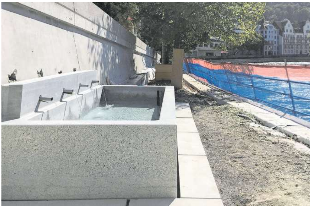
Das Thermalbecken in Ennetbaden, gebaut aus Mägenwiler Muschelkalk.