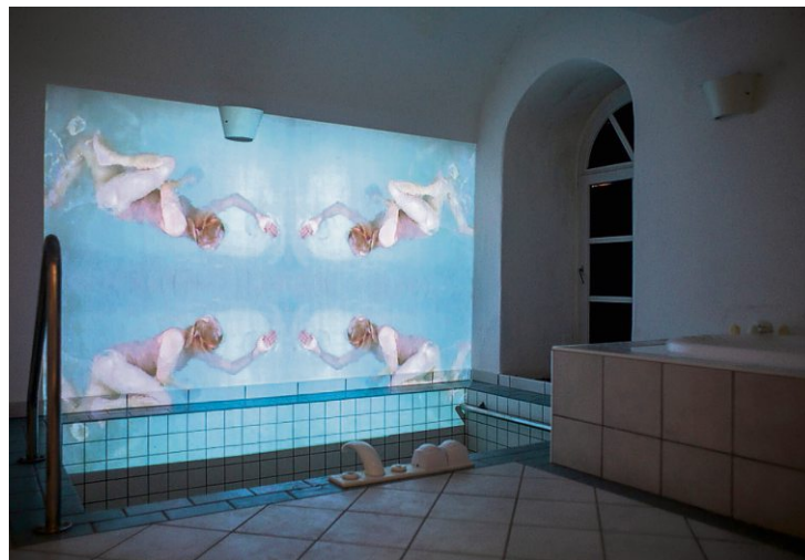
Installation des Künstlerinnenduos Bigler-Weibel in einer Badezelle.