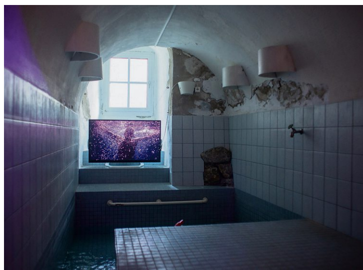
Hier nagte der Zahn der Zeit: Der Umbau soll 1,3 Millionen Franken kosten.